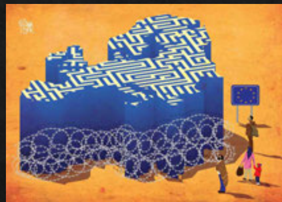
Ilustración. Diseño de Carteles. Ilustración conceptual.