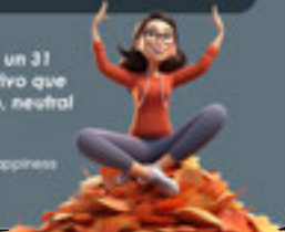
Si quieres saber más, haz clic sobre la imagen.